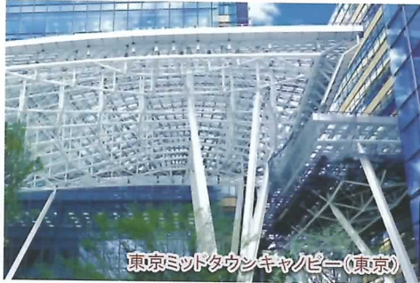
東京ミッドタウンキャンピィー(東京)

冬季インターンシップでは様々なイベントをご用意しています。 当社における建築系社員の働き方や実務を体験し、エンジニアリング 事業の醍醐味を理解する絶好の機会です。是非ともご参加ください！