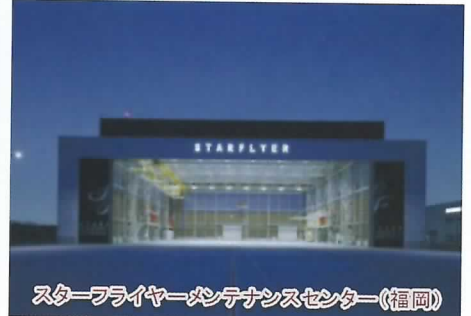
スターフライヤーメンテナンスセンター(福岡)