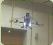
小型飛行監視 ロボット