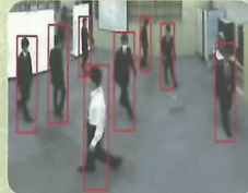
人物検知・追跡技術