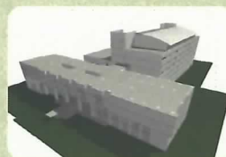
空間エンジニアリング (BIM)